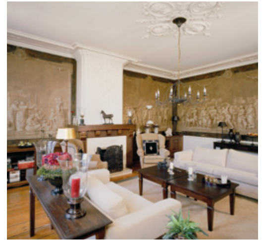
Een geschilderde Romeinse intocht kent op dit formaat bij particulieren geen equivalent